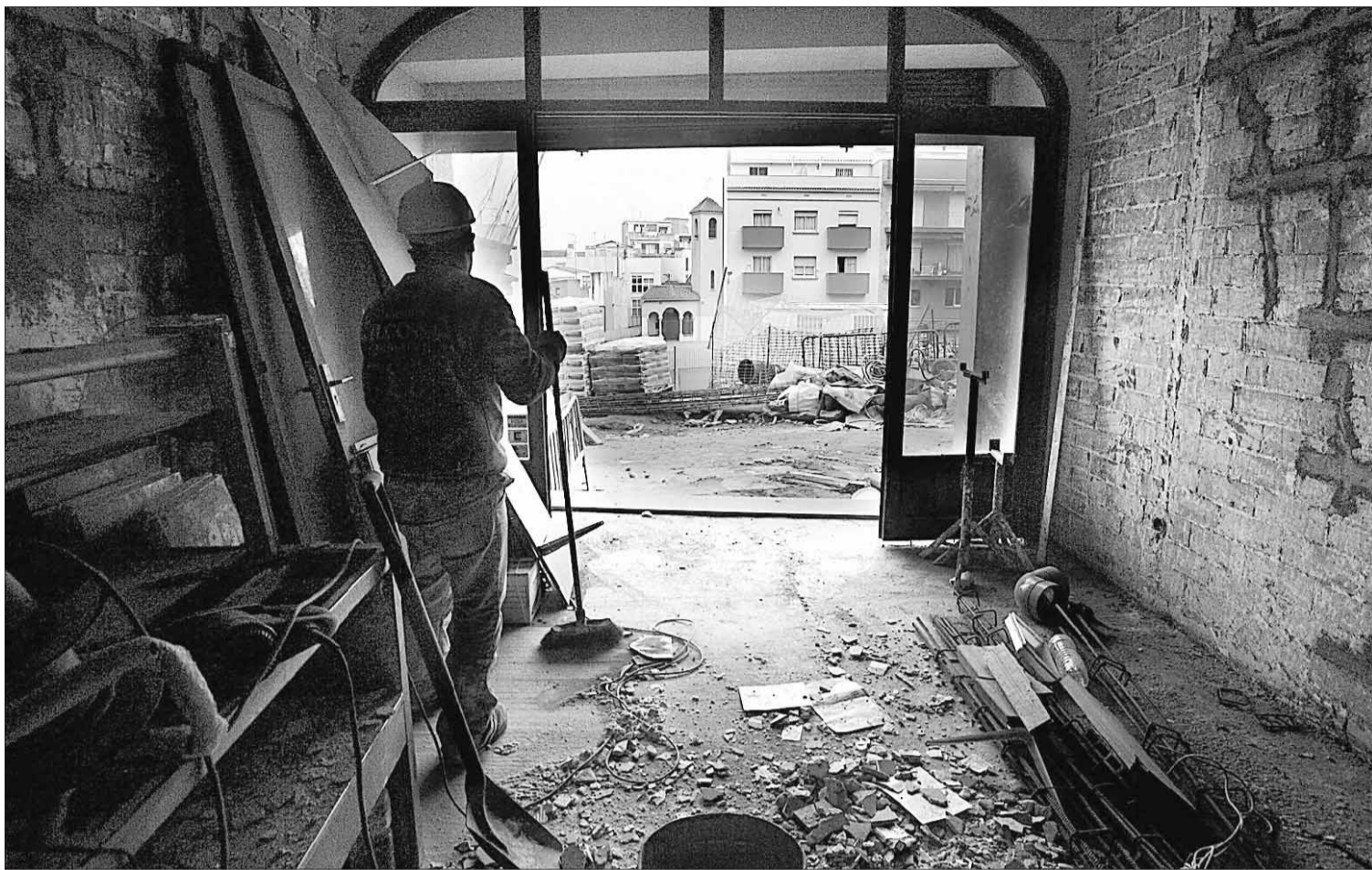
El solar donde se abrió el boquete hace un año, visto desde unas viviendas en rehabilitación.